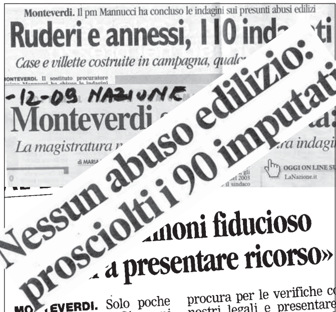
Alcuni titoli dei quotidiani nei diversi momenti della vicenda giudiziaria