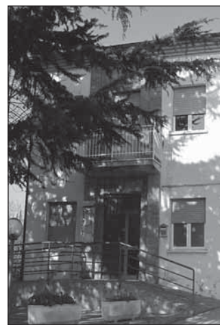
La sede del Distretto sanitario in Via del Podere

sidente e ai componenti la decisa contrarietà del Comune alla ristrutturazione della "guardia medica" così come veniva prevista dal piano dei "tagli" elaborato dall'Asl (base della "guardia medica" a Donoratico e territorio di intervento comprendente San Vincenzo, Castagneto Carducci, Sasseta, Monteverdi-Canneto). Le ragioni della delegazione monteverdina trovavano positivo ascolto da parte dei commissari regionali e il