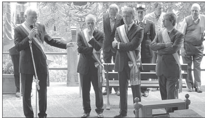
La cerimonia al monumento ai Caduti con i sindaci di Monteverdi, Sassetta e Suvereto, l'assessore provinciale Landucci, i parroci dei tre comuni e di Canneto.

Sul tavolo del sindaco però non c'è solo il teleriscaldamento, anche se quest'opera occupa tanta parte del suo tempo di amministratore pubblico e, probabilmente, dei suoi pensieri. C'è, tra i tanti, il problema di far quadrare i conti mantenendo un accettabile livello dei servizi mentre le entrate si assottigliano di anno in anno. L'Asl, ad esempio, è tornata a battere cassa: “Ci ha chiesto di aumentare di 4 euro per abitante la quota di sua competenza. Eravamo a 34 euro per abitante nel 2010, l'anno scorso siamo andati a 36, adesso si sale a 40 euro, e questo perché Stato e Regione ‘tagliano’ per risparmiare, ma scaricano sui Comuni il peso di ardue soluzioni”.